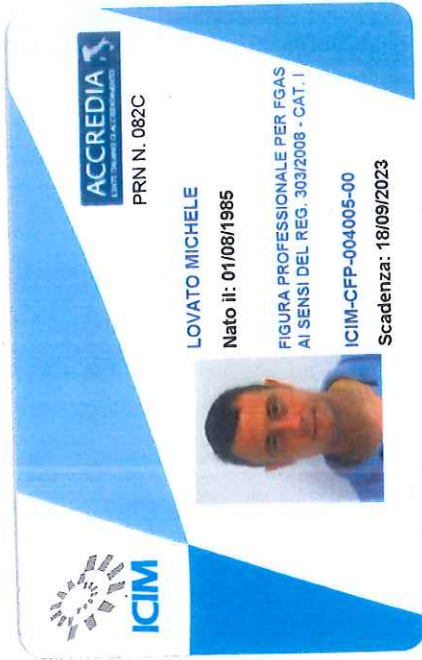
FIGURA PROFESSIONALE CHE OPERA SULLE APPARECCHIATURE FISSE DI REFRIGERAZIONE, CONDIZIONAMENTO D'ARIA E POMPE DI CALORE CONTENENTI TALUNI GAS FLUORURATI AD EFFETTO SERRA

nato a Isola della Scala il 1/8/1985 è qualificato ICIM come